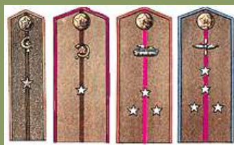
Слева направо: 1-Мл.лейтенант медицинской службы, 2-Мл.лейтенант интендантской службы. 3- Ст.лейтенант бронетанковых войск. 4- Капитан авиации.

-для интендантов, технического состава, юстиции, ветеринарной и медицинской служб цвета коричневого .