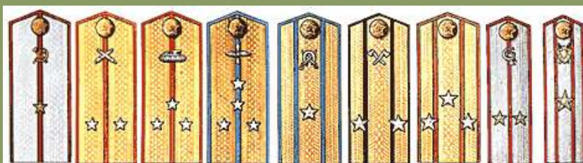
Слева направо: 1-Младший лейтенант интендантской службы. 2- Лейтенант артиллерии. 3-Старший лейтенант бронетанковых войск. 4- Капитан авиации. 5-Майор кавалерии. 6-Подполковник инженерных войск. 7-Полковник пехоты. 8-Лейтенант ветеринарной службы. 9- Старший военюрис (позднее -майор юстиции.)

Для офицерского состава вводится два вида погон - повседневные и полевые. Повседневные погоны предназначены для парадной формы и повседневной, а также для полевой формы в том случае, если она используется как повседневная. Полевые погоны предназначены для полевой формы. Размер тех и других погон одинаковый: ширина 6 см, длина 14-16 см. (в зависимости от размера одежды), но погоны юстиции, ветеринарной и медицинской службы имеют ширину не 6 см., а 4.5 см. Диаметр звездочек для младших офицеров 13 мм., для старших офицеров 20 мм. Повседневные погоны для командного состава золотые с серебристыми эмблемами по родам войск и звездочками; а для технического, административного, интендантского состава, медицинской службы, юстиции - серебряные с золотистыми звездочками и эмблемами; для ветеринарной службы- серебряные с золотистыми звездочками и серебристыми эмблемами. Пехота (мотострелки) эмблем не имела. Окантовка погон и просветы цветом по роду войск.