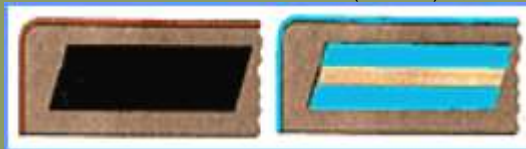
На рисунке слева мундирная петлица солдата артиллерии или танковых войск, справа сержанта авиации.

Погоны были введены с 6 января 1943 года. На новой форме петлицы, так много значившие в советской униформе с 1919 года, становятся лишь декоративным и лишь частично элементом, указывающим на служебное положение военнослужащего. Так на шинелях полевые погоны имеют цвет и окантовку одинаковую с погонами. В верхней части петлицы помещается пуговица. На парадных мундирах цвет петлицы, располагающейся горизонтально на стоячем воротнике, определяется цветом погона. У рядовых никаких знаков на такой петлице нет, у сержантов помещается нашивка из желтого или белого басона (тесьмы), одинаковая для всех званий.